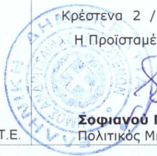
Σοφιαγού Γεωργία Πολιτικός Μηχανικός

Κρέστενα 2 / 04 / 2019 Η Προϊσταμένη Δ.Τ.Υ.